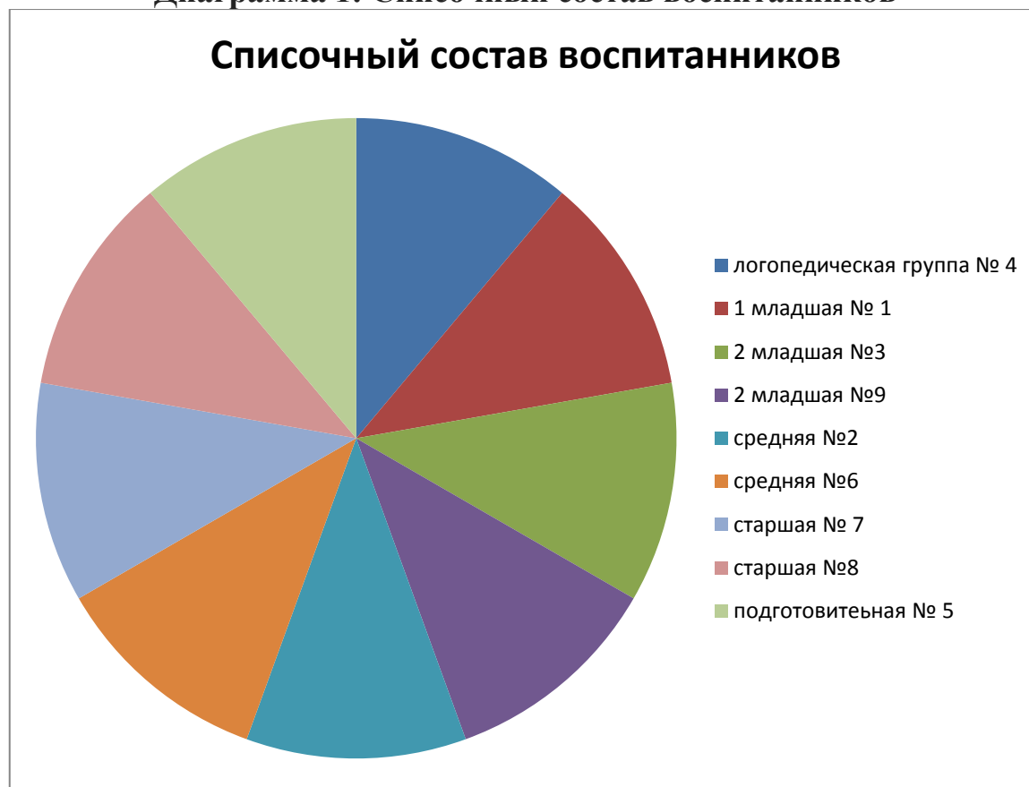
Диаграмма 1: Списочный состав воспитанников

В учреждении 9 групп общей численностью 203 воспитанника, укомплектованных по возрастному принципу. В детский сад принимаются дети с 2 лет до 7 лет в соответствии с электронной базой данных очередников.