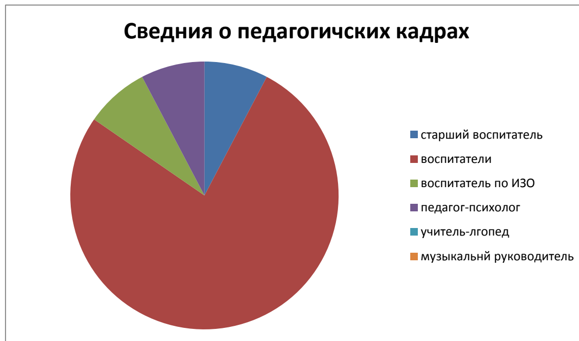
Диаграмма 3. Сведения о педагогических кадрах

Педагоги детского сада регулярно проходят процедуру аттестации: